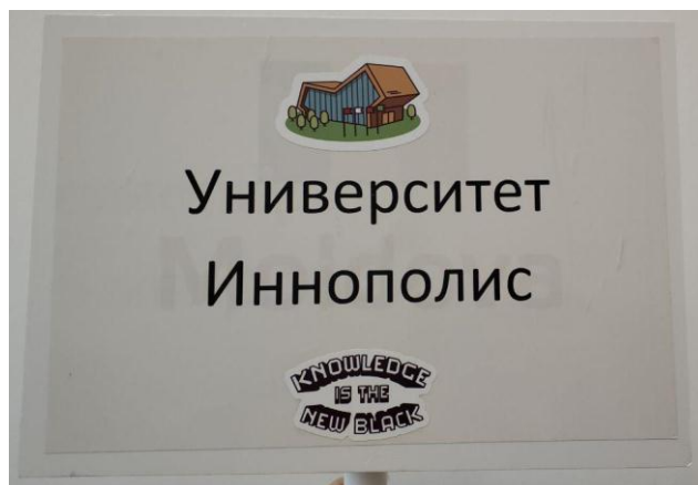
Так выглядит табличка

Если вы хотите добраться до Иннополиса самостоятельно, то актуальное расписание автобусов можно посмотреть по ссылке https://goo.gl/YSKNW4 , с помощью бота @InnoHelpBot и на сайте http://innopolis.ru/city/bus-schedule/ . Время в пути по маршруту Казань-Иннополис/ Иннополис-Казань занимает около 60 минут.