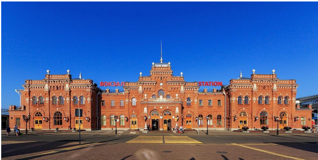
Здание вокзала Казань-Пасс.

На вокзале, возле красного здания, будут ждать волонтеры с табличками.