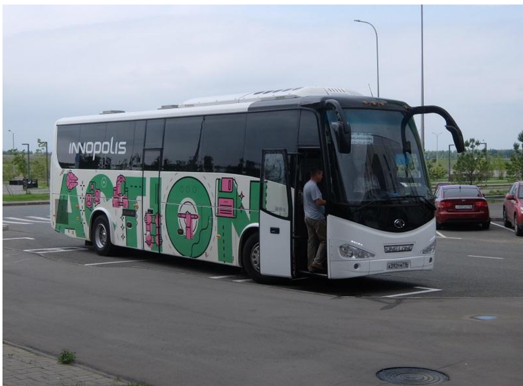
Так выглядят рейсовые автобусы г. Иннополис

На всякий случай оставляем номер междугороднего такси, цена одна из самых низких: “такси МОСТ”