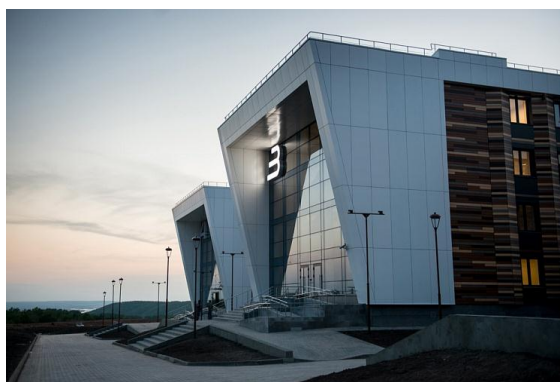
3 корпус Университета

Напоминаю, что проживание и питание сопровождающие обеспечивает себе самостоятельно. Но на сопровождающих мы забронировали места для проживания, согласно списку из анкеты логистики.